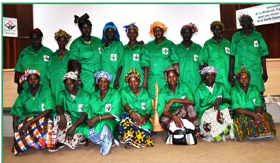
Photo 3 : Les femmes herboristes de Bamako et de Ségou bénéficiaires des kiosques

Après une série de questions et de réponses, les perspectives des activités d'appui aux herboristes ont été amplement discutées. Dans ce cadre, les recommandations les plus importantes de l'atelier ont été : (i) pour les herboristes, de s'impliquer dans la protection, la culture et l'exploitation durable des plantes médicinales et de transmettre l'amour pour les plantes médicinales aux jeunes générations ; (ii) pour les autorités communales, de réserver des espaces adéquats aux herboristes dans les marchés des villes, (iii) pour les autorités nationales, de s'engager dans la mise en œuvre de la Politique Nationale de Médecine Traditionnelle et de son plan d'action, et de mettre en place d'un Fonds National d'appui à la Médecine Traditionnelle ; (iv) pour les partenaires techniques et financiers, de reprendre la coopération avec le Mali et d'accepter d'assurer un support technique et financier durable aux actions de valorisation des plantes médicinales. Une demande particulièrement exprimée par les herboristes a été de prévoir la fourniture de moulins pour les plantes médicinales et de l'équipement technique et de matériel pour le conditionnement.