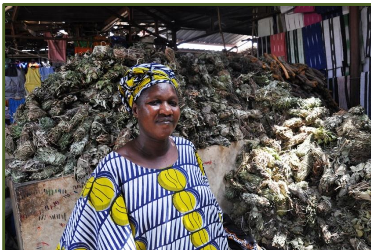
Figure 2 : Femme herboriste de Ségou (Mali)

Dans les pays tropicaux et subtropicaux, et au Mali en particulier, où les plantes aromatiques sont nombreuses et porteuses d'un potentiel important sur le plan médicinal et cosmétique, ces coûts en énergie restent difficilement surmontables, soit pour une production industrielle ou semi-industrielle que pour une production à l'échelle communautaire à haute intensité de man d'œuvre. L'énergie électrique ou les énergies fossiles sont très chères, tandis que l'utilisation du bois ou du charbon n'est pas proposable car évidemment elle n'est pas écologiquement soutenable. La solution du problème énergétique pour la distillation des huiles essentielles est donc importante pour la valorisation de la filière des plantes médicinales et pour le développement local, avec des retombées directes sur les revenus des femmes qui en sont les protagonistes.