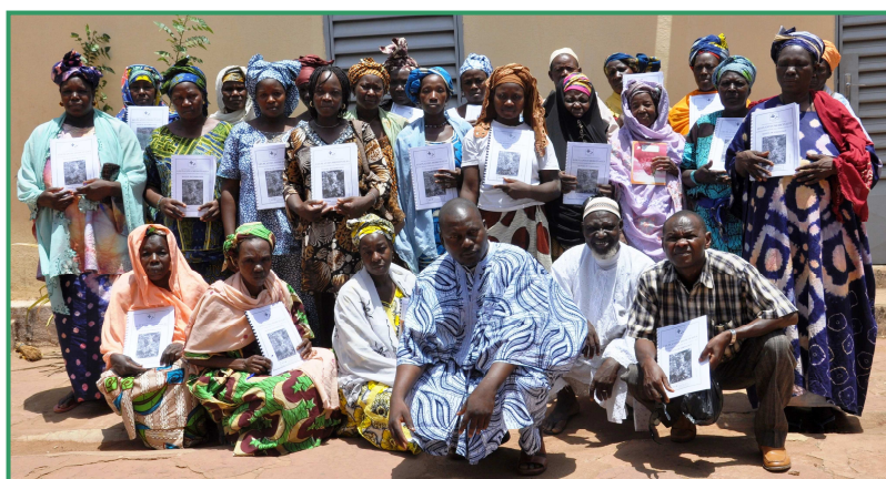
Photo n° 1 : Formazione delle erboriste della FEMATH (Bamako, aprile 2011)

Gli obiettivi delle azioni, che sono sviluppate in sinergia nel quadro del partenariato tra Aidemet Ong e la FEMATH, sono di migliorare le condizioni di lavoro e i redditi delle donne erboriste e di partecipare alla conservazione della biodiversità vegetale nel campo delle piante medicinali. Dirette beneficiarie dei due progetti sono 40 donne erboriste, di cui 30 a Bamako e 10 a Segou.