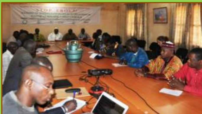
Photo n° 5 : Les participants