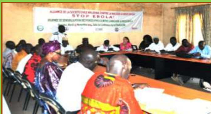
Photo n° 2 : Les participants